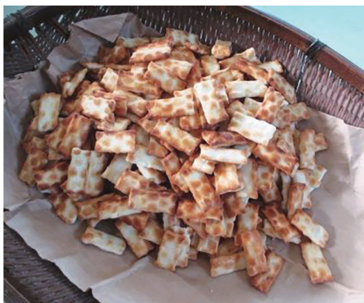
焼きたての『八荒堂』のあられ

今回ご紹介するのは、滋賀県のあられやさん『八荒堂』のギフト箱です。店主は、大変こだわりの強いお方で、箱の素材についても吟味され、最終的に身箱は大和オリジナルボールのエースボール。蓋箱は、牛乳パックの再生紙ロスクリームを気に入られました。発売の頃より今日まで永く渡つてこの箱を使用されています。身箱と蓋箱のカラーコントラストがなるとなく丁寧に作られたあられを連想させます。