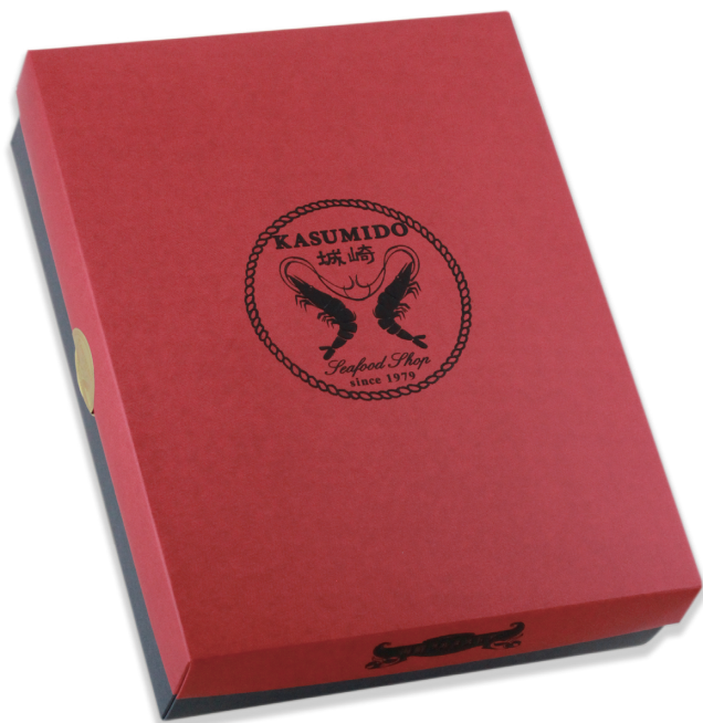
香すみ堂株式会社の手焼き海鮮せんべい。

紙（パッケージ）の世界も出合が大切です。この度、美しいのはもちろんの事、エコ性の高いパッケージを目指し、包まずとも心の伝わるギフトの箱をこしらえました。