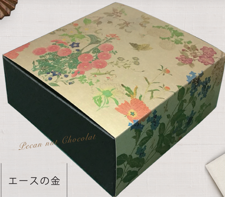
Pecan nut Chocolate