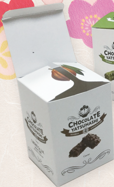
ハツ橋入りクランチ・チョコレート カカオ・イチゴ・抹茶(西尾ハツ橋)