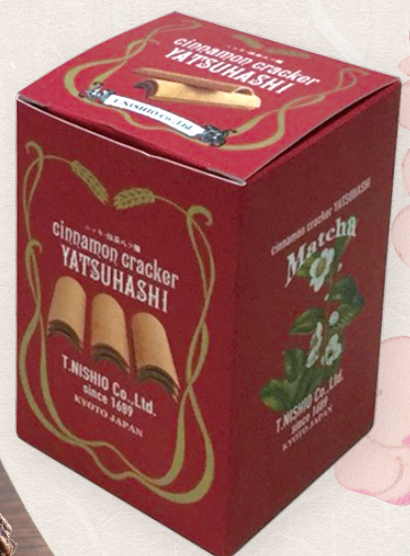
ハツ橋 ニッキ(西尾ハツ橋)