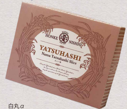
白丸α ただの白ではない白を