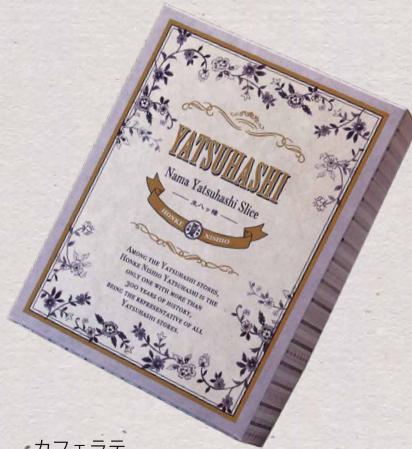
カフェラテ カフェラテのニュアンスを大切に サイドは王朝のさらさを使用