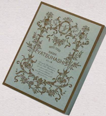
ゆるチップ レトロな中にシックな色を