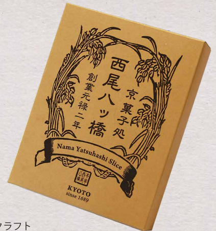
0クラフト 本来の紙の色を大切に...これぞ八つ橋。