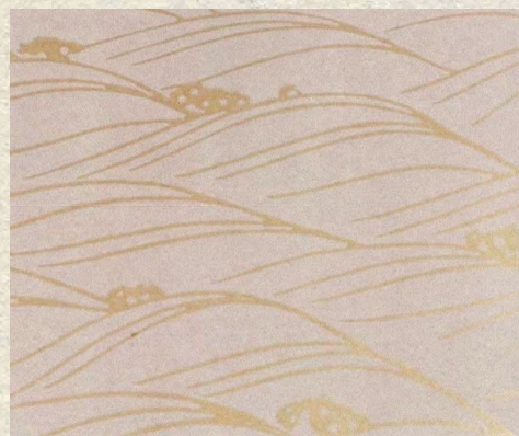
CLOUD GRAY-F×秋の文様 唐紙 稲穂の波 (イエローグレー)