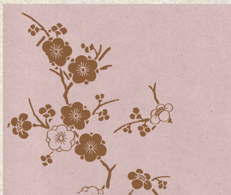
ゆるチップF(もも)×春の文様 京の梅