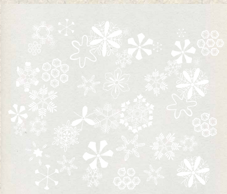
UボードホワイトF×冬の文様 雪の結晶