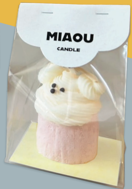
[ ゆるチップ (つき) ] 230 g/m 2