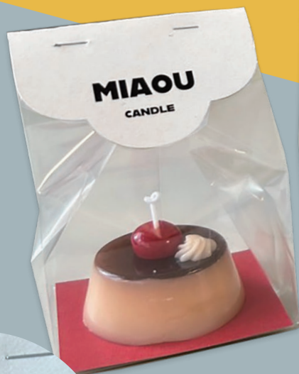
[ カッパーレッド F ] 270 g/m 2

大和板紙のオンラインサイトには、「ちょこペパ」という、自宅でも扱いやすいサイズに裁断したお好きな板紙をお選びいただき、気軽に購入できる商品があります。ご自身でカットして色々な組み合わせをお楽しみください。