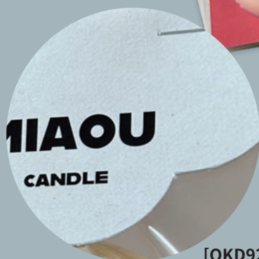
[ OKD92 ] 260 g/m 2