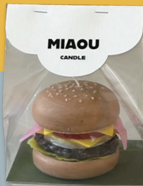
[ モスボール ] 230~400 g/m 2